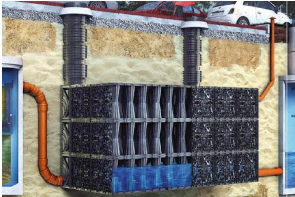
Zakład Usług Komunalnych Sp. z o.o. w Czersku